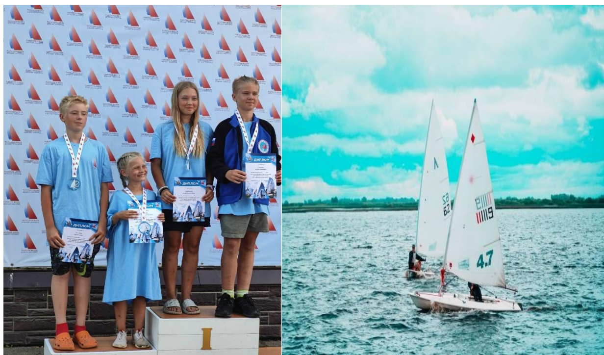
Рис.16. Соревнования по парусному спорту "56 Ильменская регата"2025.

Участие приняли 16 спортсменов из Центра Детско-юношеского туризма и парусного спорта. Было проведено 10 гонок во всех классах.