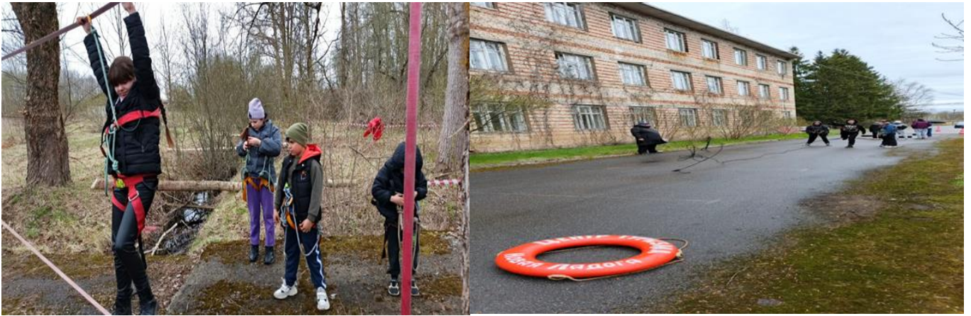
Рис .6. X муниципальная туристско-краеведческая Олимпиада школьников Волховского района 2025г.

Результат комплексного зачета команд сложился по сумме мест двух видов.