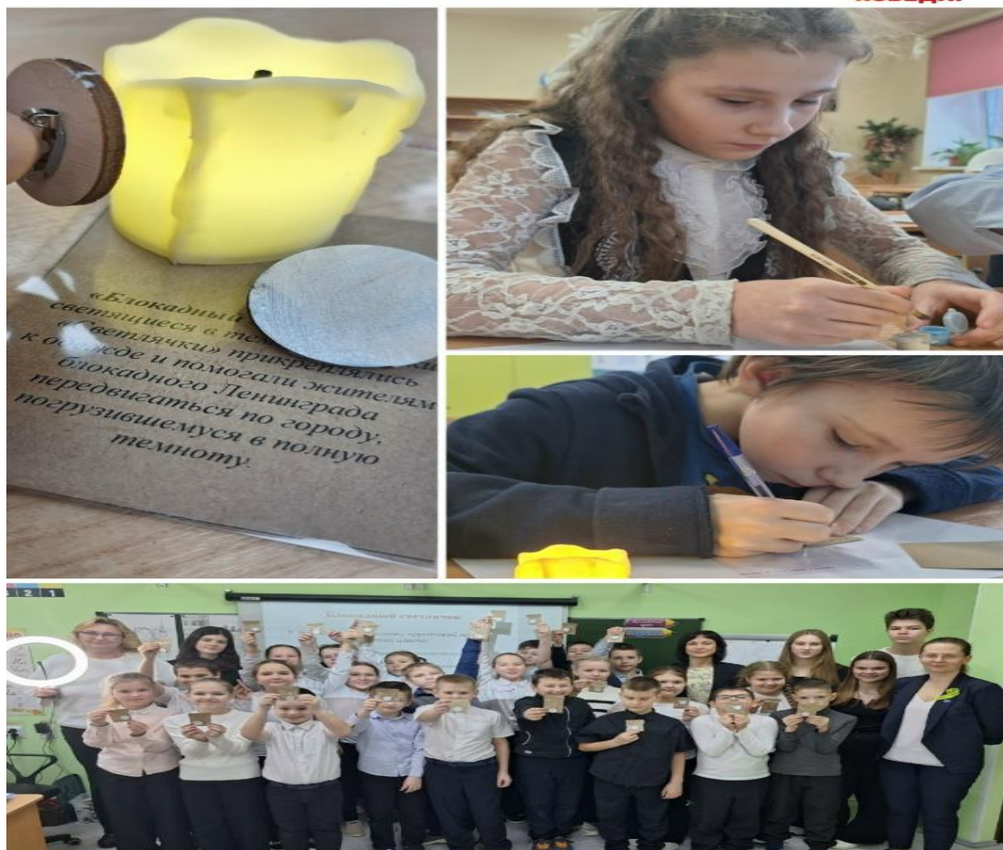
Рис .3. Мастер-класс «Блокадный светлячок».

С 17 по 19 января 2025г. в г. Сосновый бор на базе ДДЮТ "Ювента" прошли спортивные сборы парусных команд и школ Ленинградской области.