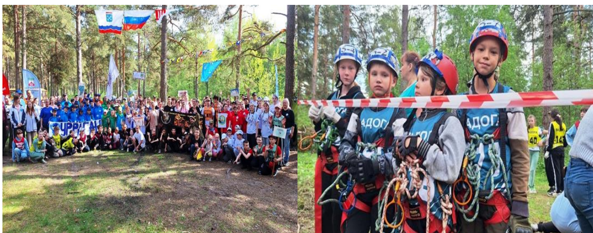
Рис .8. XIII турслет школьников Волховского района, III туристский слет работников.

30 мая 2025 года в Марьиной роще, г. Новая Ладога состоялся XIII турслет школьников Волховского района, III туристский слет работников образовательных организаций Волховского района.