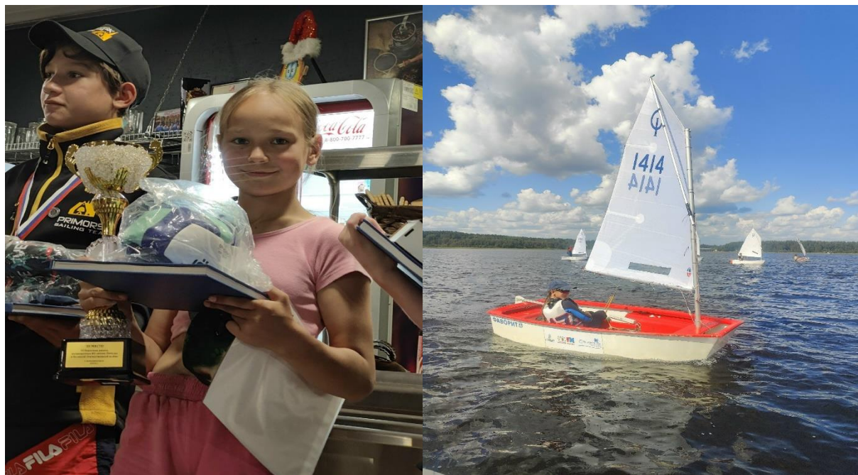
Рис.17. Соревнования по парусному спорту, 6 парусный фестиваль "Вуокса"

С 1 по 3 августа 2025 года спортсмены Парусной команды Фортуна принимали участие в 6 парусном фестивале "Вуокса" посвященном 80-летию Победы в Великой Отечественной войне.