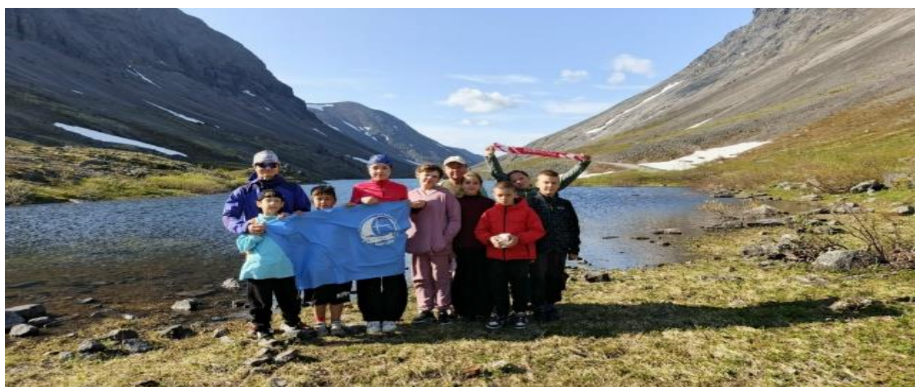
Рис.13 – Поход 3 категории сложности «Хибини 2025».

С 05.07. по 14.07.2025 года воспитанники центра детского туризма г. Новая Ладога, Волховского муниципального района, Ленинградской области отправились в пешеходный поход третьей категории сложности в г. Кировск Мурманской области, Хибин.