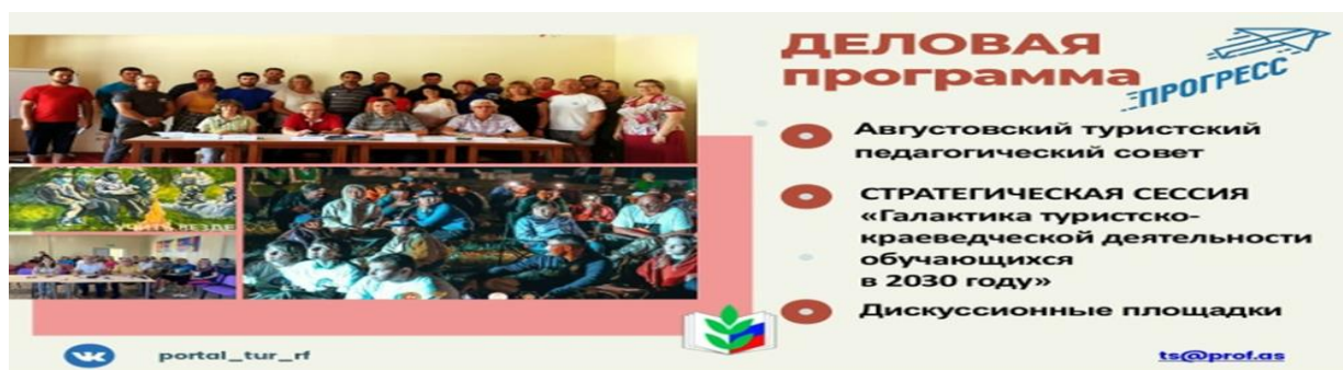
Рис.17. XXXII Всероссийский туристский слёт педагогов

XXXII Всероссийский туристский слёт педагогов традиционно собирает наиболее активных представителей туристского педагогического сообщества. Участие приняли команды из 50 регионов. Количество участников – более 1000.