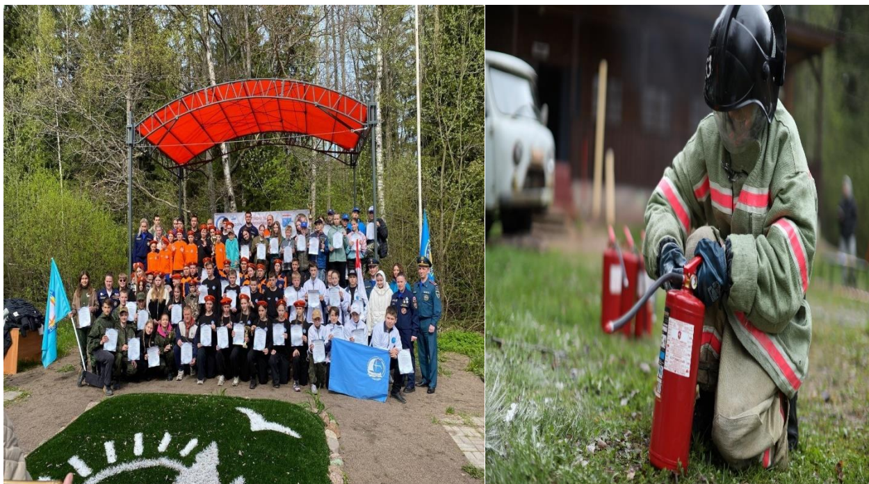
Рис .7. Региональные соревнования "Школа безопасности" 2025г.

Команда принимала участие в различных видах соревнований. На церемонии награждения участники заняли результаты в каждом виде: 1 место в виде "Физическая подготовка"; 2 место в следующих видах: "Комбинированная пожарная эстафета", "ПСР на акватории", "Знатоки ПДД"; 3 место в видах: "Маршрут выживания", "ПСР техногенного характера", "Военизированная полоса препятствий". В итоговом зачете соревнований младшая команда заняла 3 место.