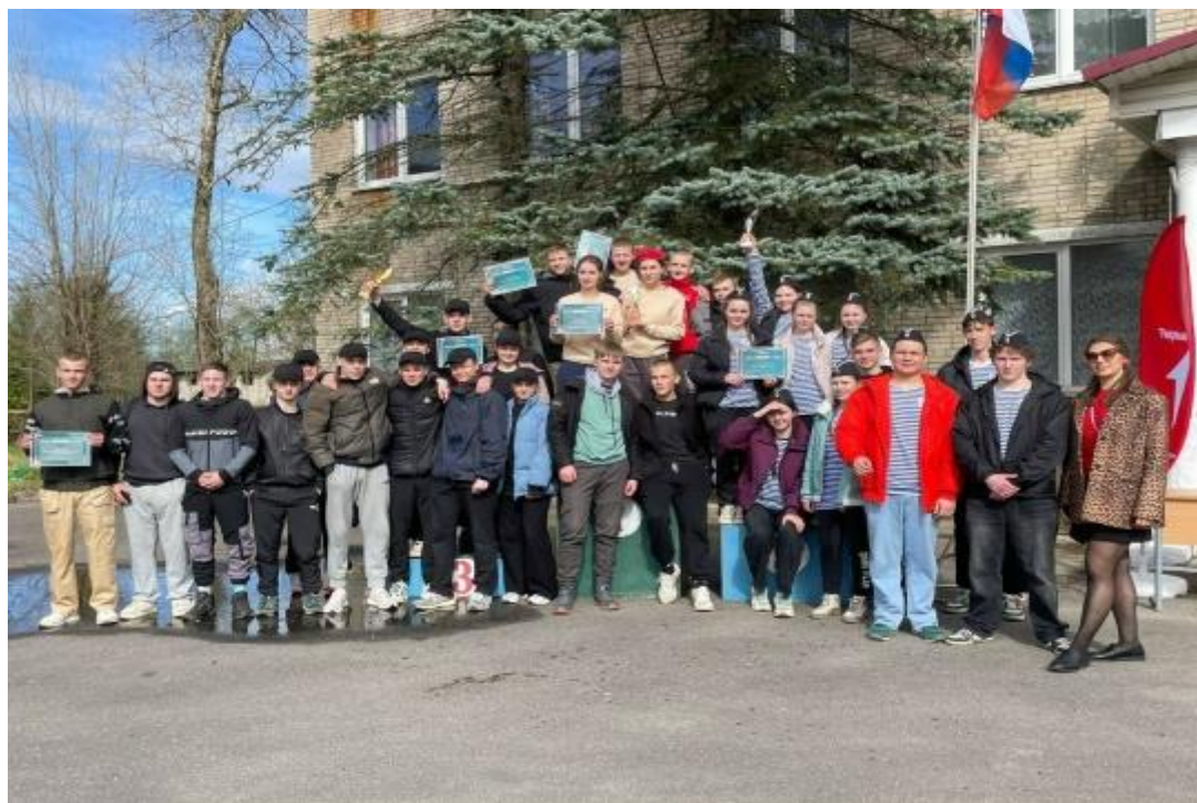
Рис .5. Муниципальный этап Всероссийской военно-патриотической игры «Зарница 2.0» 2025г.

18, 21, 24 апреля 2025 года в Волховском районе состоялся муниципальный этап Всероссийской военно-патриотической игры «Зарница 2.0» среди учащихся начальных классов, рисунок 5.