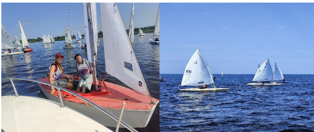
Рис .11. Первенство и Чемпионат по парусному спорту Ленинградской области. 2025г.

110 участников из Сясьстроя, Новой Ладоги, Приморска, Выборга, Соснового бора, Токсово, Великого Новгорода, Санкт-Петербурга, Петрозаводска, Новосибирска, принимали участие в соревнованиях.