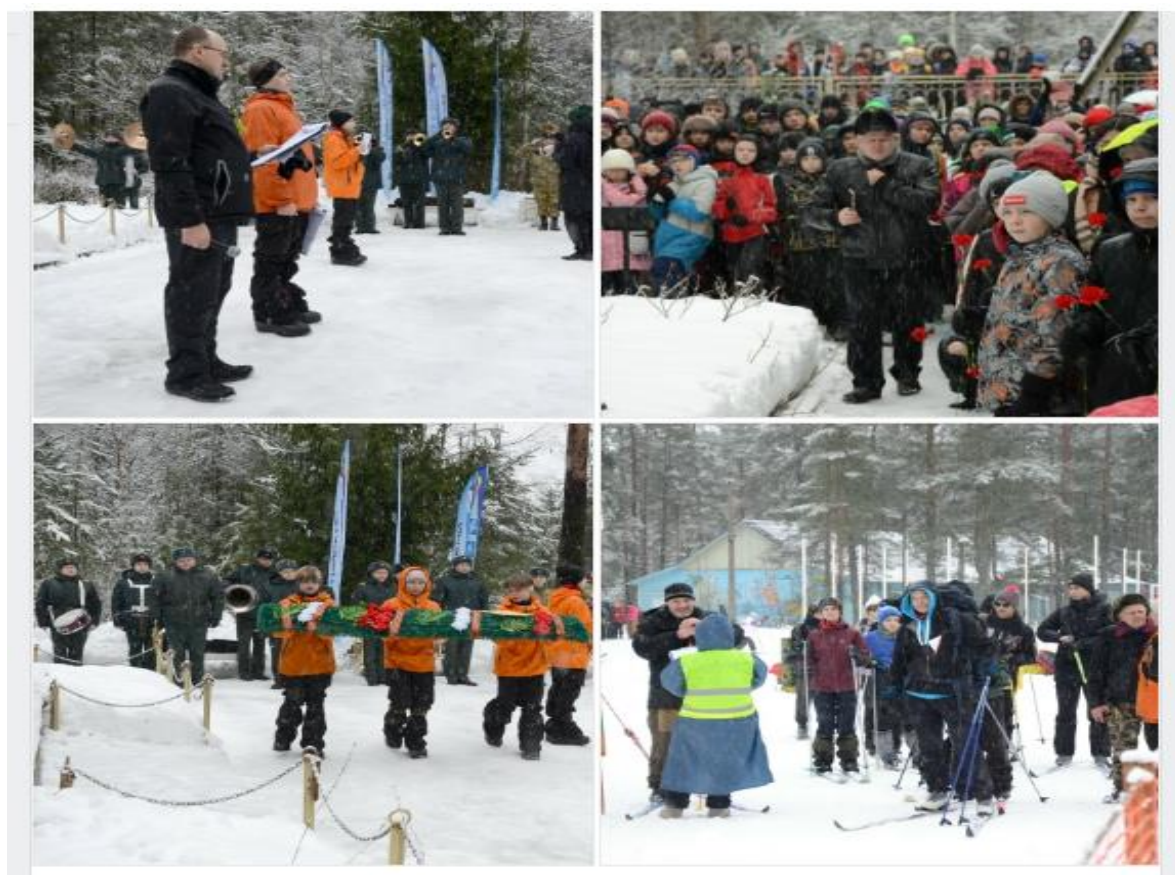
Рис .1. Участие в Звездном лыжном походе.

Обучающиеся Центра детского туризма в эту памятную дату приняли участие в Звёздном лыжном походе школьников, рисунок 1.