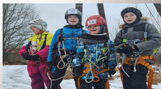
Рис .2. XII муниципальные соревнования по спортивному туризму «Дистанция» в зимних условиях.

Соревнования проведены на дистанции первого класса сложности, где показали свои умения 29 команд (118 участников) из МОБУ «Сясьстройская СОШ №1», МОБУ «Сясьстройская СОШ №2», МОБУ "Новоладожская СОШ имени вице-адмирала В.С. Черокова", МОБУ "Пашская СОШ", МОБУ "Волховская СОШ №1", МОБУ "Волховская СОШ №7", МОБУ "Волховская СОШ №6", МОБУ "Волховская СОШ №8", МОУ "Усадищенская СОШ", МОБУ "Староладожская СОШ имени Героя Советского Союза В.Ф.Голубева", МОБУ «Волховская СОШ №7», «Алексинская СОШ», «Кисельнинская СШ», МОБУ «Гостинопольская СОШ», а так же участники личного зачета.