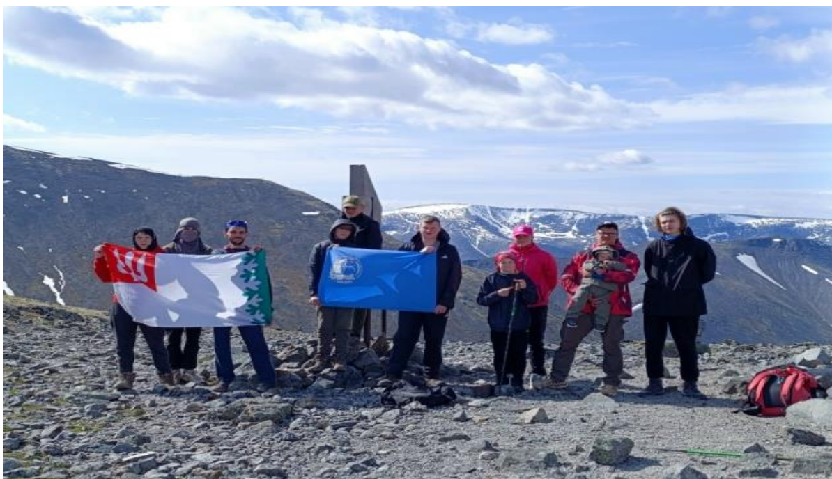
Рис.14 – Поход 1 категории сложности «Красоты Хибин 2025».

Команде удалось успешно преодолеть запланированный маршрут в 100 км и достигнуть 5-ти нелёгких горных перевалов.