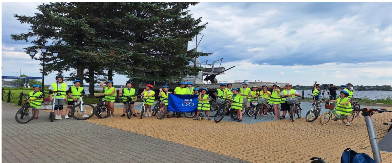
Рис.15 – Всероссийский проект «ЮИД в движении».

В июле 2025 года в Волховском районе стартовал Всероссийский проект «ЮИД в движении», направленный на патриотическое воспитание молодежи и формирование культуры безопасного поведения на дорогах. Проект организован Министерством просвещения Российской Федерации и Государственной автомобильной инспекцией. Проект реализуется Общероссийской общественной детско-юношеской организацией «Юные инспекторы движения» в рамках федерального проекта «Безопасность дорожного движения» национального проекта «Инфраструктура для жизни».