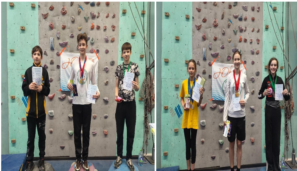
Рис .4. Награждение парусной команды на спортивных сборах 2025г.

Финалом сборов стали соревнования в каждом из видов проведенных занятий.