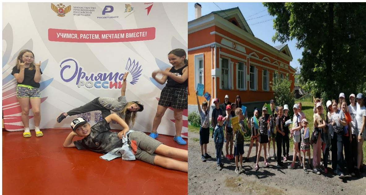
Рис.12 - профильный лагерь дневного пребывания "Путешественники", "Орлята России", «Спортивный туризм»

Кто-то проходит адаптацию, кто-то замыкается в себе, задача педагога- вывести всех обучающихся на один уровень, стать равными, помочь воспитанникам преодолевать свои страхи, научиться уважать друг друга, быть единым целым- одной командой, достичь новых результатов, отработать новые навыки и знания и применять их на практике.